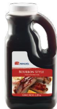
Salsa Tipo Bourbon